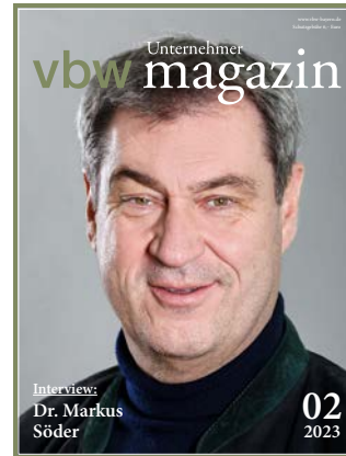
Dr. Markus Söder