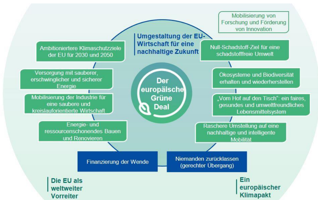
Abbildung 1 Kernziele des Europäischen Green Deal